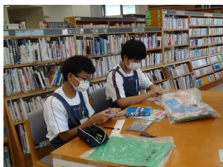
おすすめ本のPOP作り・移動図書館車に本の補充(河浦)