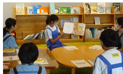
本棚の整理・移動図書館での貸出・カウンター業務・読み聞かせ(中央)